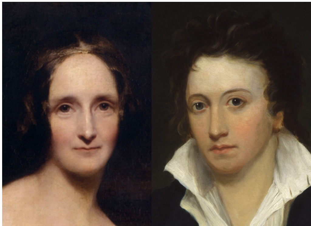
Fig. 4 Mary Godwin Shelley e Percy Bysshe Shelley

della sua autonomia e del suo diritto di scegliere il proprio destino, in un'epoca in cui le donne erano spesso soggette alla volontà paterna o coniugale. La sua decisione di seguire il proprio cuore, nonostante le pressioni sociali e familiari, riflette l'influenza delle idee progressiste dei suoi genitori, in particolar modo della madre, che sappiamo essere stata pioniera del pensiero femminista 43 .