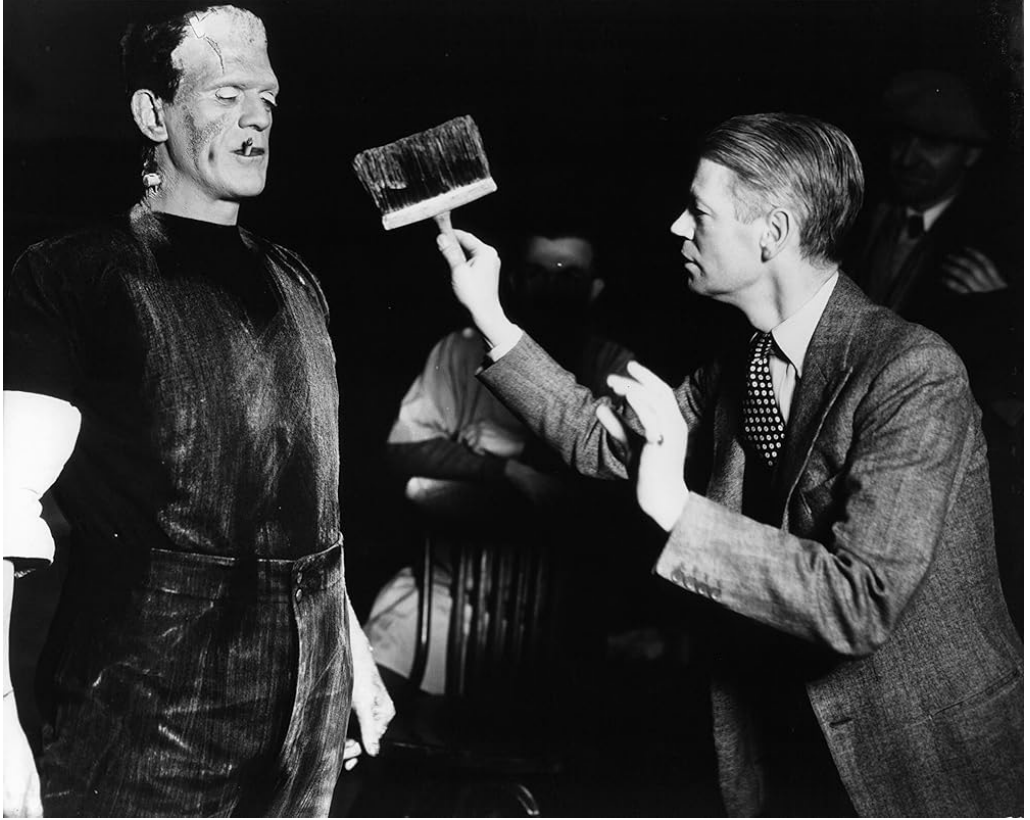
Fig. 1 Boris Karloff e James Whale, 1931

Whale, inoltre, infonde nel prologo un tono di ironia e sarcasmo, soprattutto nel modo in cui Mary Shelley viene ritratta quando racconta della morte del mostro nel suo romanzo: la scena appare quasi come una battuta teatrale. Il regista si serve di questa introduzione per fornire una riflessione sul potere della narrazione 3 e sul ruolo del regista di manipolare i personaggi e le narrazioni. La figura di Shelley viene infatti messa in evidenza come una sorta di creatrice di miti, ma Whale sembra anche suggerire che, attraverso il cinema, questi miti possono essere continuamente rielaborati. Whale è oggi riconosciuto come uno dei registi più originali del cinema horror classico proprio perché pone attenzione su un concetto che sarà ripreso non solo in campo cinematografico, ma anche in quello artistico e della moda: la ricreatività . Il film stesso si fa carico di rielaborare e reinventare il mito, aggiungendo nuove sfumature e significati attraverso il linguaggio del cinema.