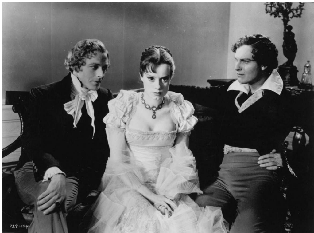
Fig. 2 Mary Shelley (Elsa Lanchester) tra il marito e Lord Byron in The Bride of Frankenstein