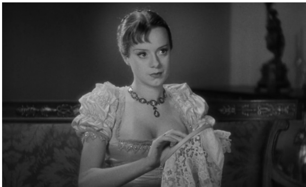
Fig. 3 La scollatura oggetto di censura