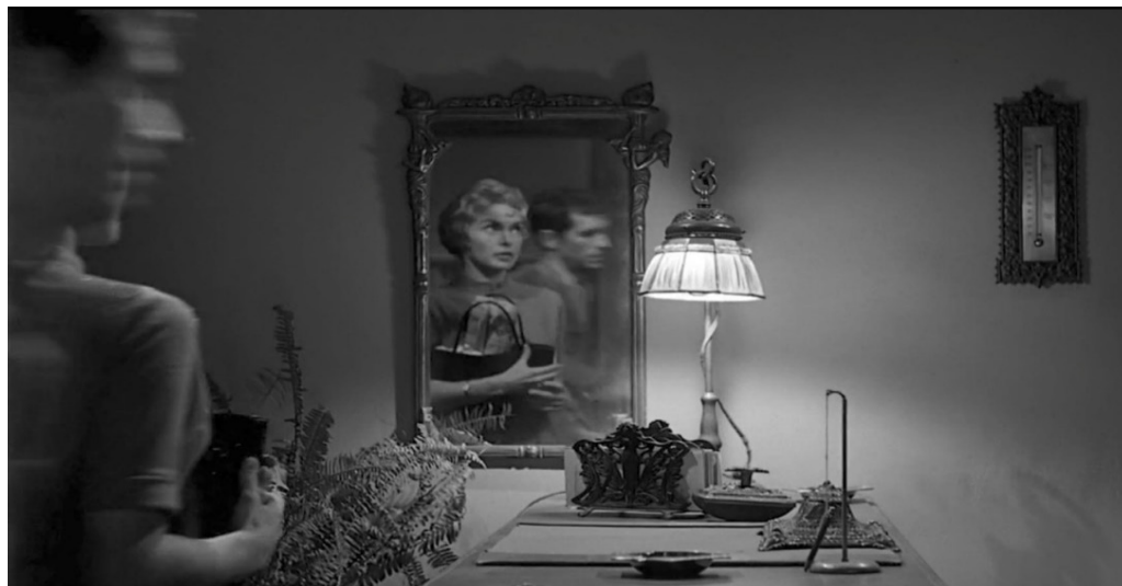
Fig. 10 Il doppio ( Psycho , min. 28"24)

di una barca intrappolata nella propria cornice; un gufo impagliato che non può volare via; infine, il libro d'immagini pornografiche, un artificio finalizzato a sperimentare il contatto umano, senza però offrire una reale intimità o affetto 51 .