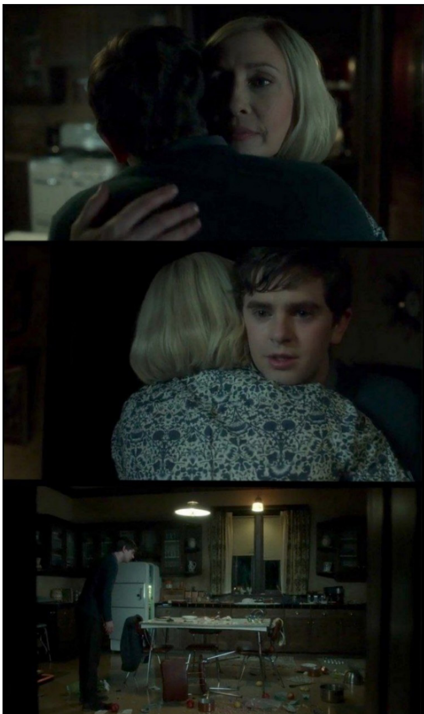
Fig. 15 «Ognuno di noi è stretto nella propria trappola» (Psycho, min. 37"56-38"03; Bates Motel, #506, min. 31"47-53)