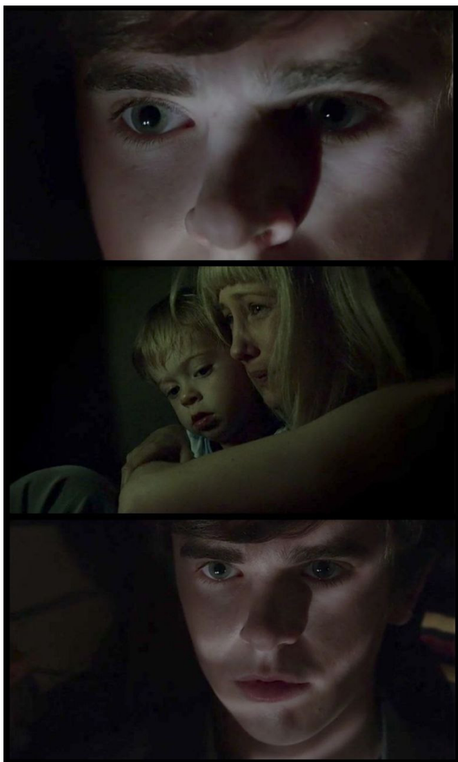
Fig. 12 Flashback d'infanzia ( Bates Motel , #206, min. 14"14-22)

Brennan. In questa situazione, la mente di Norman rievoca un episodio simile risalente alla sua infanzia; probabilmente all'interno di un guardaroba, lui e sua madre si nascondono dal padre, un uomo violento dipendente dall'alcol. Norma, per quanto sia spaventata, cerca di rassicurarlo, ma nonostante gli sforzi il suo terrore è evidente, ed entrambi si stringono l'un l'altra per cercare conforto. Durante l'elaborazione di questo flashback Norman rimane pietrificato, con lo sguardo fisso nel vuoto, per un lasso di tempo indefinito ( Bates Motel , #206, min. 13"46-14"37).