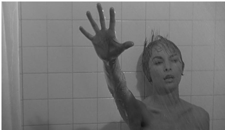
Fig. 6 Marion chiede aiuto (Psycho, min. 48"29)