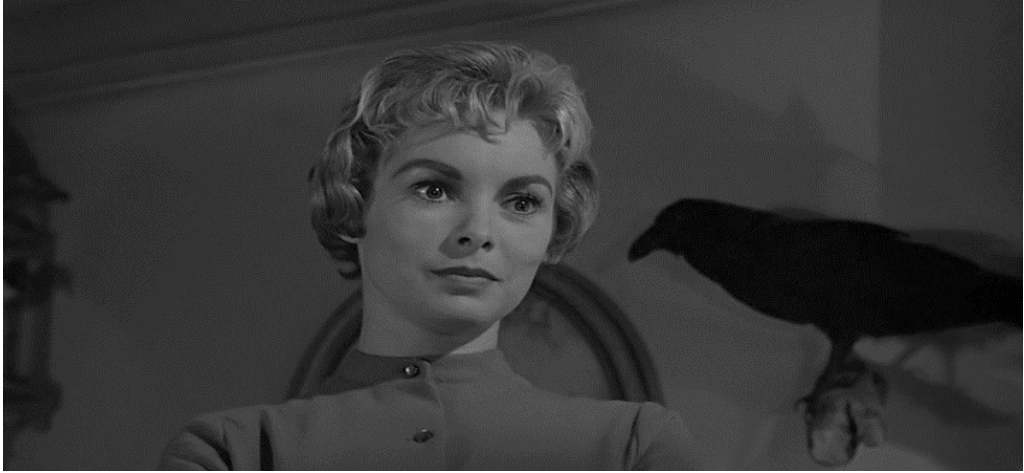
Fig. 3 La vittima ( Psycho , min. 43"28)

Come già anticipato, è lo stesso Hitchcock a suggerire una forte sovrapposizione dei suoi protagonisti con la scena circostante; sono infatti molteplici i riferimenti alla natura duplice di Norman, nonché quelli al pericolo cui è sottoposta Marion.