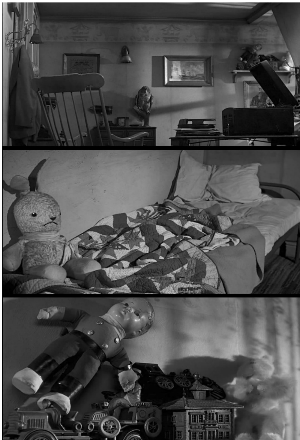
Fig. 9 La camera di Norman ( Psycho , min. 1'38"33-53)