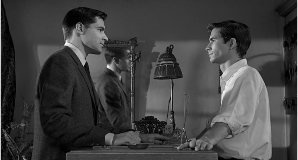
Fig. 11 Sam o Norman? ( Psycho , min. 1'39"27)

A supportare questa impressione, vi è il fatto che Hitchcock ponga il pubblico dinnanzi a un confronto indiretto tra Norman e Sam, rendendolo esplicito durante la loro conversazione al bancone del motel. Sam è una presenza fortemente virile all'interno del film, a partire dalla sua estetica che, in buona parte, permise al suo interprete di ottenere il ruolo. Difatti, nonostante Gavin non avesse colpito Hitchcock per le sue doti attoriali, presentava una buona forma fisica, oltre a risultare particolarmente mascolino 62 , e quindi adatto a effettuare questo confronto con Norman. Sam si mostra inoltre molto sensuale e sicuro di sé nel rapportarsi con Marion, trasmettendo, di conseguenza, un senso di protezione nei suoi riguardi. Norman, al contrario, ha una corporatura esile e slanciata, mostrandosi insicuro e nervoso nel rapportarsi con gli altri. Nel rapporto con Marion, Norman manifesta un registro emotivo più vulnerabile e partecipe rispetto a Sam, contribuendo a differenziare ulteriormente i due modelli di maschilità proposti dal film 63 .