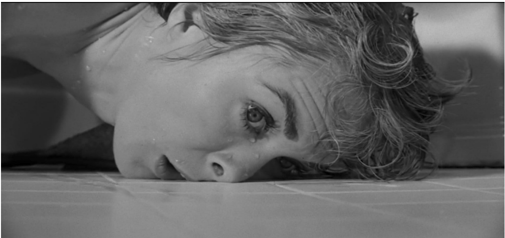
Fig. 2 La morte di Marion ( Psycho , min. 49"29)

È proprio tale sproporzione a costituire il fondamento dell'horror, concetto ripreso da Marilyn McCord Adams all'interno del suo I mali orrendi e la bontà di Dio 19 . Secondo la studiosa, i mali orrendi distruggono la possibilità che la vita di una persona abbia un significato positivo, là dove tale distruzione non fa riferimento a una categoria morale. La particolarità di questa tesi risiede nel fatto che le conseguenze possono verificarsi in egual misura sia nella vita della vittima sia nella vita del persecutore, anche in assenza di una scelta malvagia deliberata; Norman Bates è uomo che rovina le vite altrui, ma allo stesso tempo è anch'egli rovinato. Il criterio principale dei mali orrendi riguarda il modo in cui la punizione superi in maniera sproporzionata ogni crimine possibile 20 , nonché la dinamica che si può evidenziare nella morte di Marion. Quest'ultima aveva commesso il furto di una somma ingente di denaro, che peraltro aveva deciso di restituire due giorni dopo. Anche in un regime che ammettesse la pena capitale, la morte era per lei una punizione necessaria?