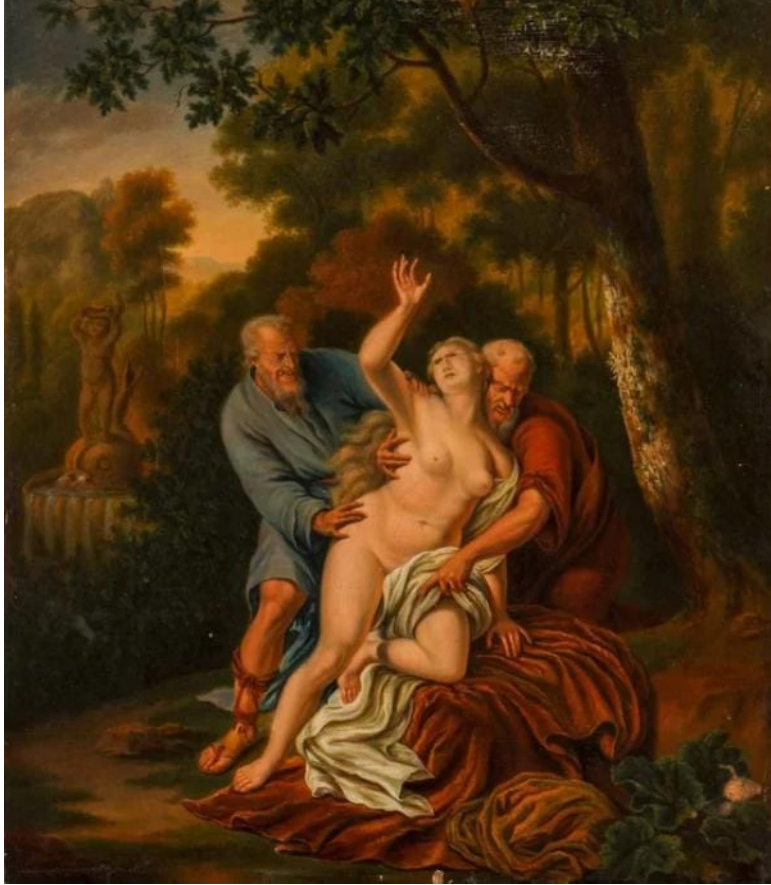
Fig. 5 Willem van Mieris, Susanna e i vecchioni, 1731 (Musei reali delle belle arti del Belgio, Bruxelles)