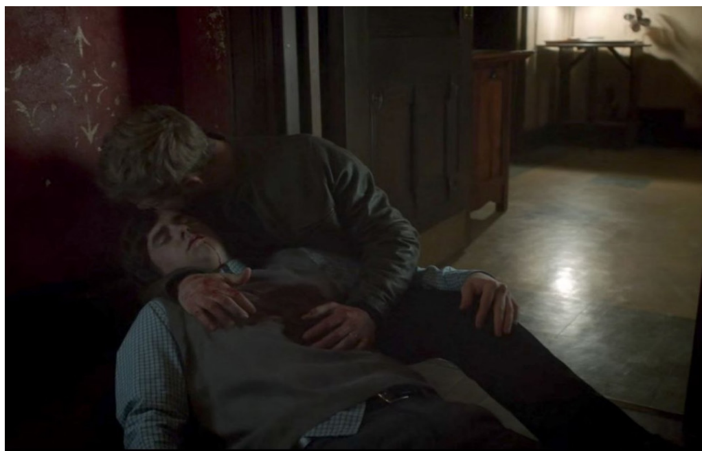
Fig. 14 «Grazie» ( Bates Motel , #510, min. 39"36)