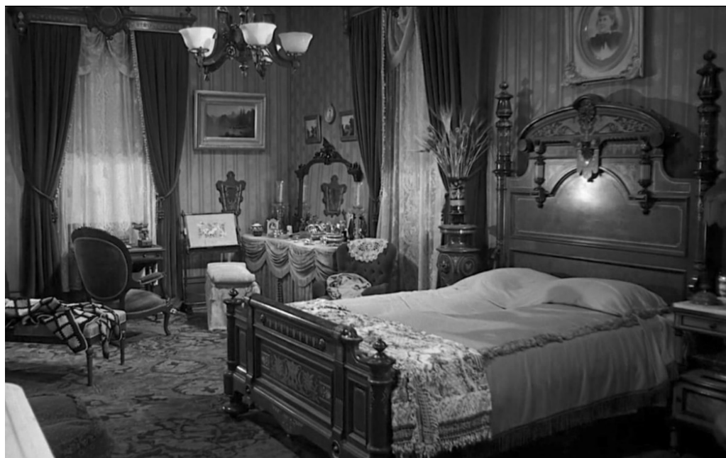
Fig. 8 La camera da letto della madre, Psycho, min. 1'37"01.