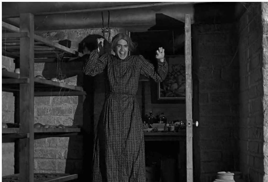
Fig. 7 Madre (Psycho, min. 1'41"26)