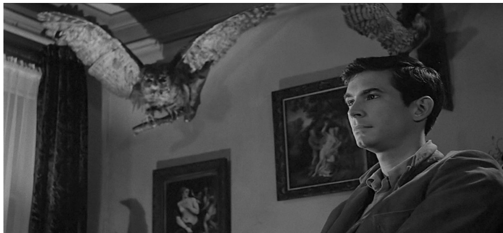
Fig. 4 I carnefici ( Psycho , min. 39"08)

a una bella ragazza trova difficoltà persino nel nominare il bagno o nel parlare del materasso, probabilmente pensando a una possibile allusione sessuale. 31 La sua fragilità emotiva viene inoltre simboleggiata nel momento in cui, scoperto il cadavere di Marion, fa cadere involontariamente il quadretto di un uccellino, mandandolo in frantumi.